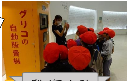
グリコピア・イースト

グリコ工場では、身近なお菓子がどのような作業や工程を経て作られているのか見学することができました。